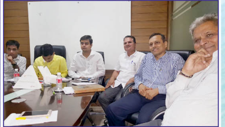
જુલેન્દ્ર કારીયા કાર્યાલય મંત્રી